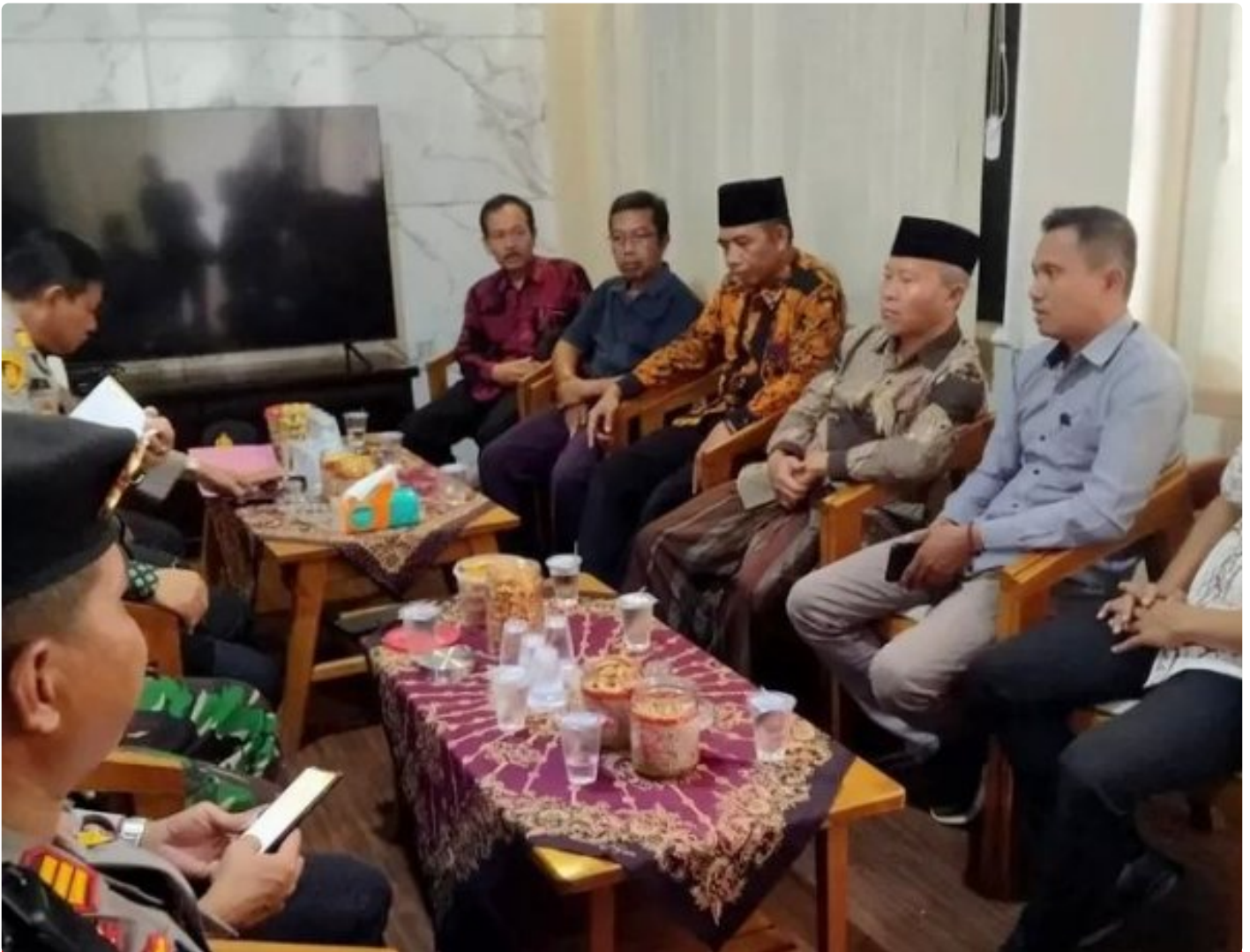
Audiensi tokoh agama yang tergabung di Aliansi Umat Islam dengan Forpimka Cluring

BANYUWANGI - Meskipun meresahkan, keberadaan toko yang menjual secara bebas minuman keras beralkohol berbagai merek yang berada di Desa Benculuk tepatnya di depan Rumah Makan Tudung Saji ini nampak aman-aman saja. Menyikapi hal tersebut, Aliansi Umat Islam Kecamatan Cluring melakukan aksi damai pencegahan maraknya peredaran minuman keras (miras) dan